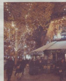
A l'approche des fêtes, des associations dénoncent la « pollution lumineuse ».

Selon L'Atlas mondial de la clarté artificielle du ciel nocturne , du P.N. Cassano, les halos lumineux progressent de 5 % par an en Europe, et masquent aujourd'hui la vision de 90 % des étoiles dans les métropoles. Ainsi, l'alternance jour-nuit s'estompe peu à peu, l'obscurité s'éclaircit, créant un effet de voile qui efface insidieusement la voûte céleste et fragilise la faune nocturne. Les oiseaux migrateurs, habitués à se diriger avec les étoiles, sont attirés par les halos lumineux et désorientés par les phares en mer. De nombreux insectes sont menacés : attirés par la lumière, ils viennent griller vifs sur les luminaires ou deviennent des proies faciles pour leurs prédateurs. Chauve-souris et hiboux désertent les clochers qui restent éclairés la nuit. Quant aux astronomes, ils sont obligés de s'éloigner de plus en plus des villes pour retrouver un peu de ciel noir dans lequel on distingue les étoiles. Et le gâchis énergétique est réel : l'Agence de l'environnement et de la maîtrise de l'énergie estime qu'on pourrait faire 40 % d'économies sur les dépenses d'éclairage